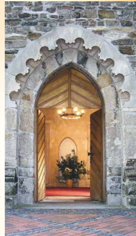
Realisation: kollundkollegen.