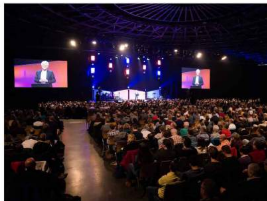
Der EKD-Ratsvorsitzende Landesbischof Heinrich Bedford-Strohm im Plenum „Welt“ im Velodrom/Berlin