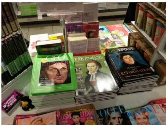
reformation 2017: Das Magazin in der Bahnhofsbuchhandlung Kassel-Wilhelmshöhe

Zwischen GeoEpoche und Cosmopolitan: Das Publikums-magazin der AMD hat seinen Weg in die Riege der Premiumprodukte im Zeitschriftenhandel gemacht. Mit einer Gesamtauflage von ca. 100.000 Stück ist es seit über einem Jahr an Bahnhofskiosken und anderen Pressevertriebsstellen zu kaufen und erreicht damit auch Menschen, die keinen Zugang zur Kirche haben. Mit den unterhaltsamen Geschichten rings um die Reformation, den aufwändig produzierten Bilderstreifen und einem kompakten Glaubenskurs ist es gelungen, Absender- und Adressateninteresse erfolgreich zu verbinden.