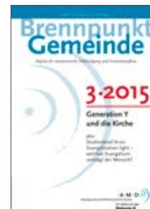
Sechs Mal im Jahr Impulse für missionarische Verkündigung und Gemeindeaufbau, dieses Jahr u. a. zur Generation Y, KMU V, Flüchtlingen und Gemeinwesenorientierung.