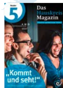
Der Reader „Kommt und seht“ des Hauskreis-Magazins rückt Film und Kunstwerke in den Fokus von Kleingruppen.