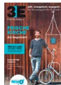
Das Magazin 3E liefert anregende Impulse für haupt- und ehrenamtliche Mitarbeit.

Die AMD war in Kooperation mit dem Evangelischen Missionswerk (EMW) Mitveranstalter des Kongresses „Mission: Respekt“, bei dem im August 2014 rund 250 Teilnehmende aus aller Welt über „Christliches Zeugnis in einer multireligiösen Welt“ berieten. Im Nachgang zu diesem Kongress und zur Fortsetzung des Rezeptionsprozesses sind dazu verschiedene Materialien erschienen: eine Arbeitshilfe für Gemeinden, Gruppen und diaconisch-caritative Einrichtungen, die Erkenntnisse des Kongresses und weitere Impulse zusammenfasst, sowie eine Ausgabe der AMD-Zeitschrift „Brennpunkt Gemeinde“ (2 / 2015).