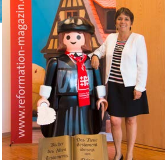
Dr. Margot Käßmann, EKD-Botschafterin für das Reformationsjubiläum, mit dem AMD-„Sonderbotschafter“, der lebensgroßen Luther-Figur von Playmobil.