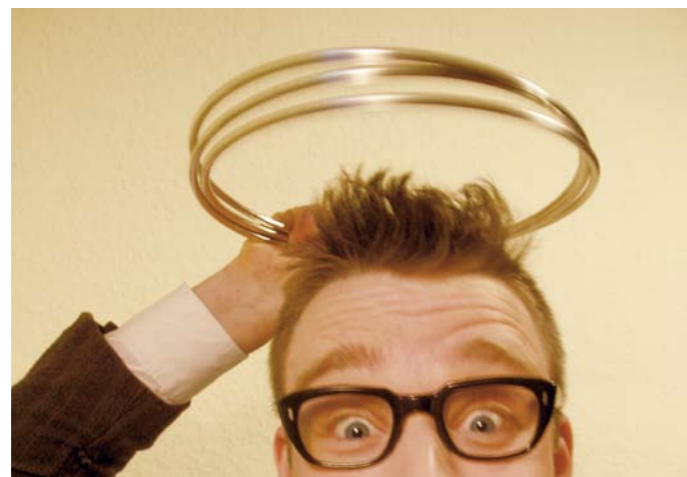
Bildrechte werden noch geklärt