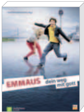
Leiterhandbuch inkl. CD-ROM, Gottesdienstentwürfen uvm. (19,99 €)

Dieses Kurskonzept für 14–17jährige spiegelt die EMMAUS-Prinzipien wider. Die 15 Einheiten verstehen sich als Denkanstöße, die inhaltlich der „Dramaturgie“ des Kurses für Erwachsene folgen. Sie sind methodisch vielfältig, interaktiv, kreativ und prozessorientiert angelegt. EMMAUS – dein weg mit gott ermöglicht, dass Jugendliche die Essentials des Glaubens in entspannter Atmosphäre kennen lernen und ihren persönlichen Glaubensweg entdecken können.