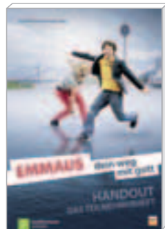
Teilnehmerheft (3,00 €)