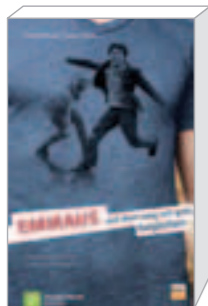
Begleiter-Buch (4,90 €)